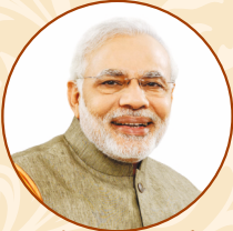
શ્રી નરેન્દ્રભાઈ મોદી માન. પ્રધાનમંત્રીશ્રી, ભારત સરકાર