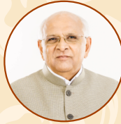
શ્રી ભુપેન્દ્રભાઈ પટેલ માન. મુખ્યમંત્રીશ્રી, ગુજરાત રાજ્ય